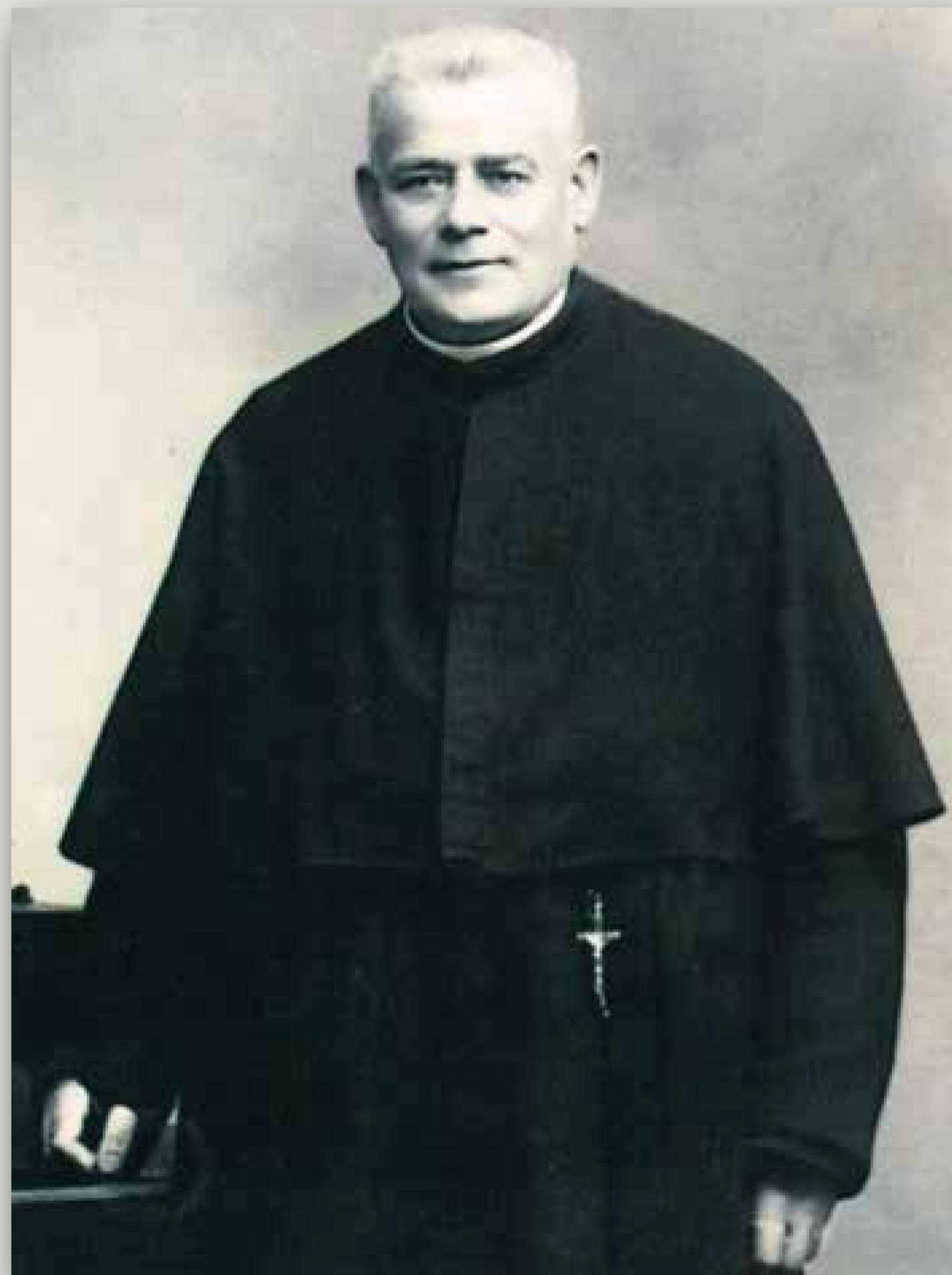
Il Fondatore a Friburgo (1917)

La Società del Divin Salvatore era composta da 455 membri (197 sacerdoti. 112 fratelli. 53 scolastici. 83 candidati del clero e 10 candidati fratelli).