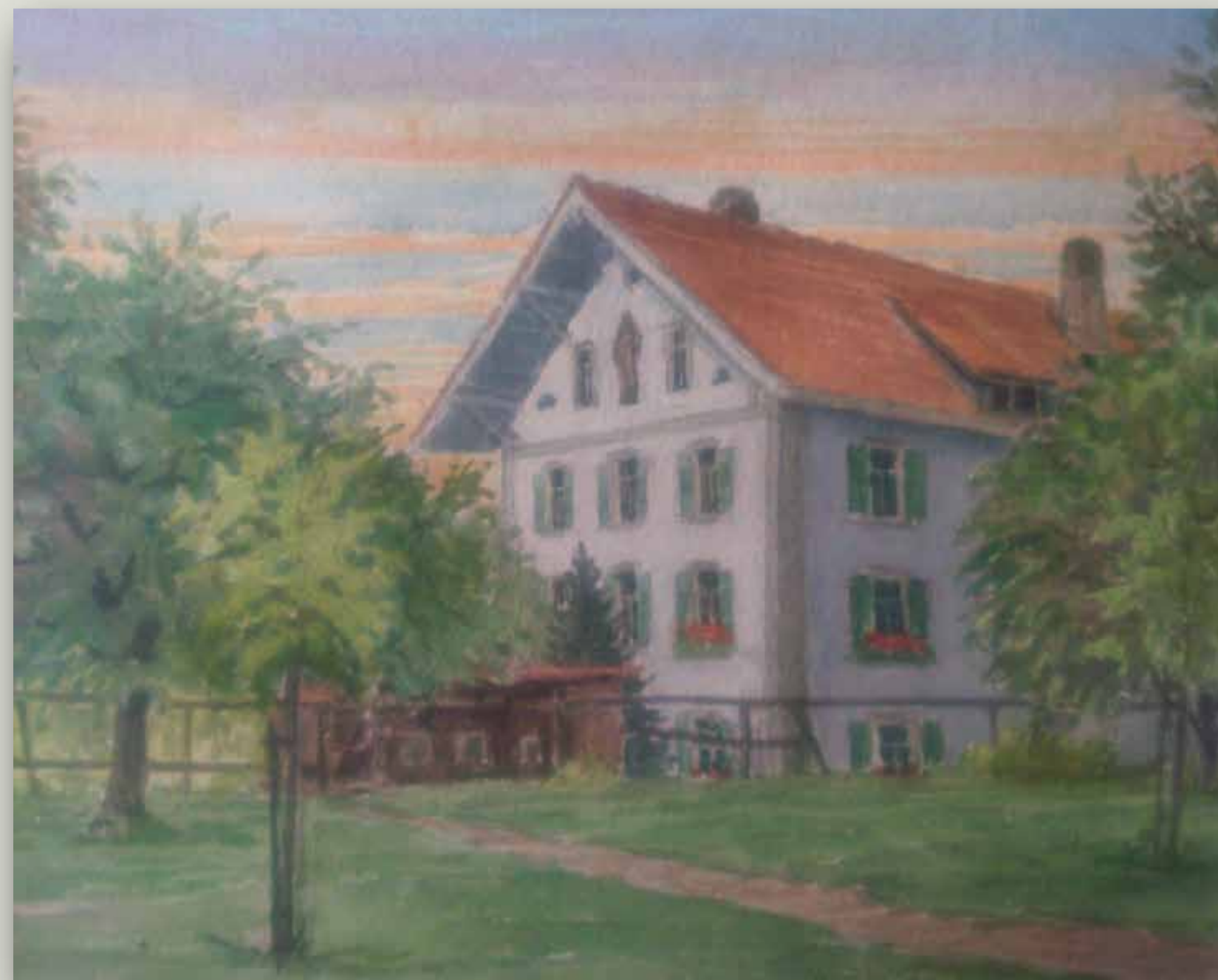
Ospedale di Tavers - Svizzera

Lo stato di salute del Fondatore peggiorava di giorno in giorno e fu portato all'ospedale per i poveri nel villaggio di Tavers, Svizzera, dove morì in pace. L'8 settembre P. Jordan fece ritorno alla casa del Padre con queste parole: "Coloro che verranno dopo di noi ricorderanno la nostra sofferenza e continueranno il lavoro."