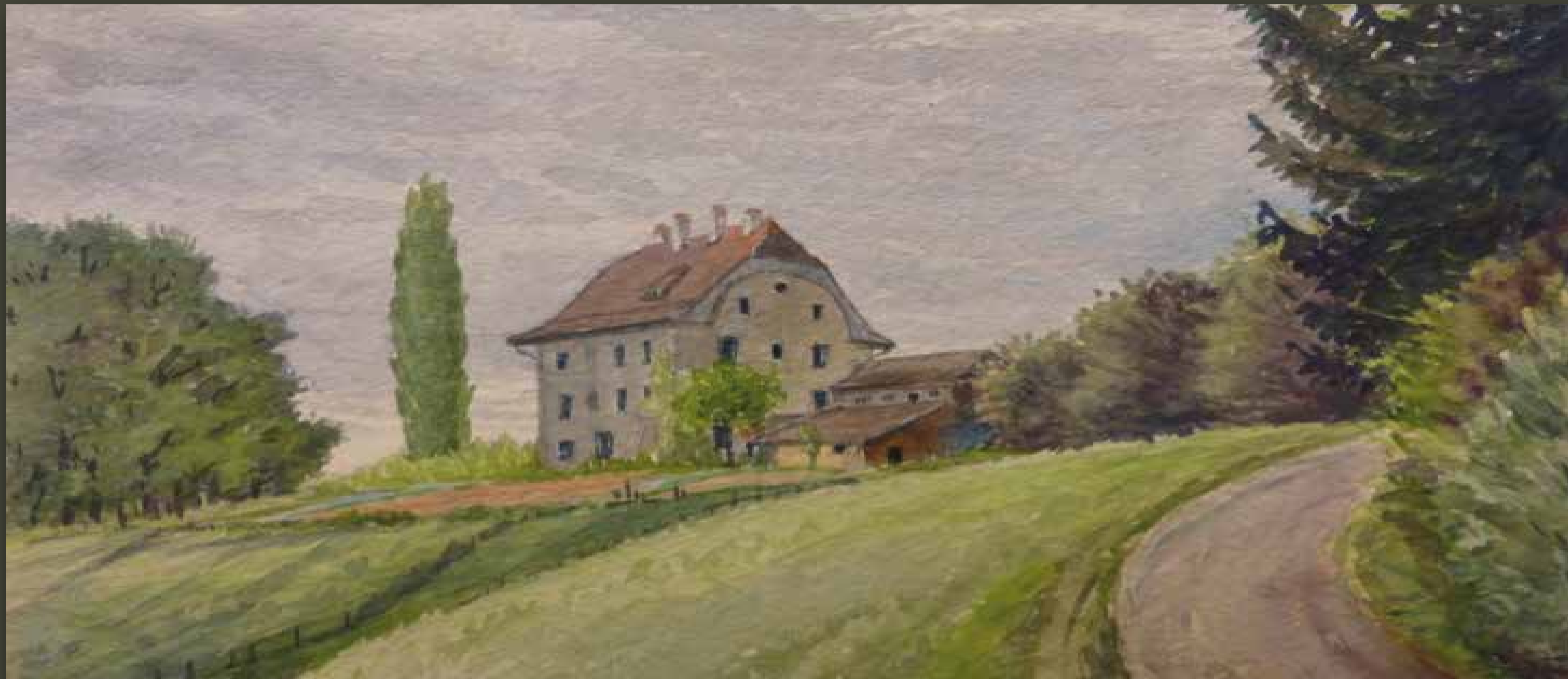
Dipinto della Casa di Maggenberg - Svizzera